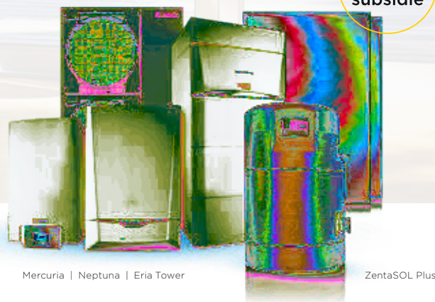
Mercuria | Neptuna | Eria Tower